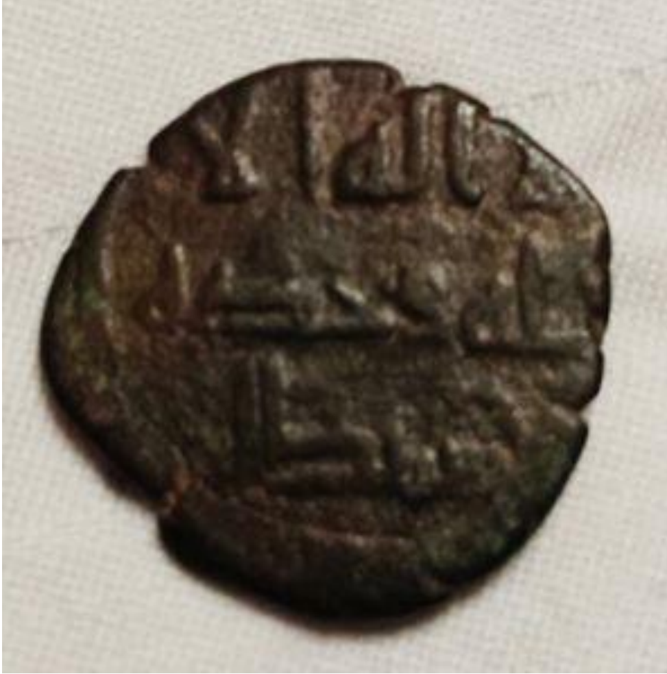
لوحة رقم 1 لوجه الفلس