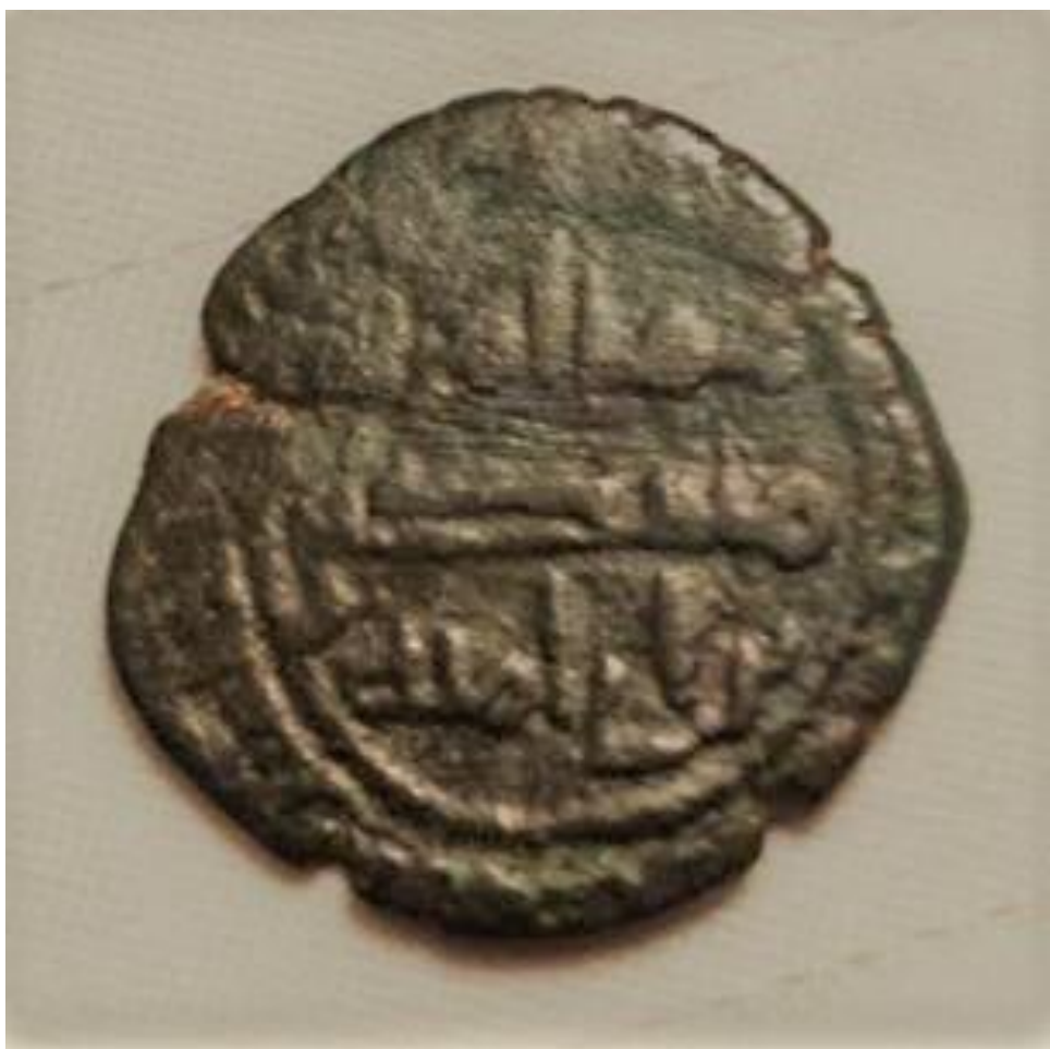
لوحة رقم 2 لظهر الفلس